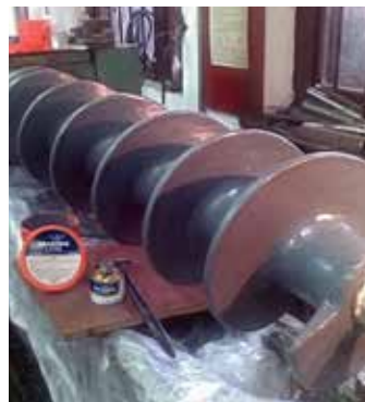
Transportadores helicoidais protegidos