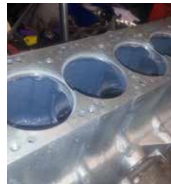
Bloco de motor revestido