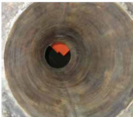
Cone de aço antes do revestimento