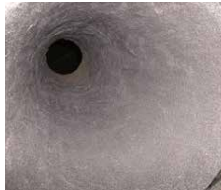
Cone de aço revestido com Belzona 1812

Para obter mais informações, entre em contato com o representante local Belzona: