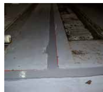
Reparado com Belzona 4521

Para obter mais informações, entre em contato com o representante local Belzona: