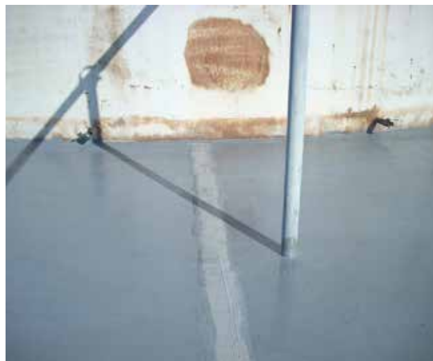
Usado para restaurar juntas imperfeitas em área de contenção

Aplicado manualmente, sem necessidade de trabalho a quente ou ferramentas especiais, reduz o tempo de inatividade.