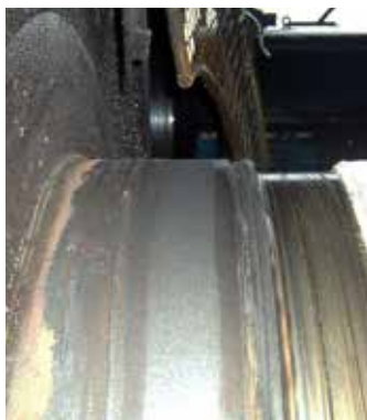
Área de vedação reparada