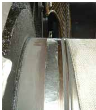
Anéis de vedação desgastados