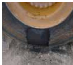
Moldagem de novo componente