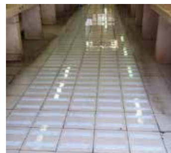
Piso ladrilhado depois

Para obter mais informações, entre em contato com o representante local Belzona: