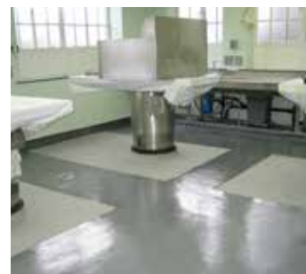
Piso de concreto depois