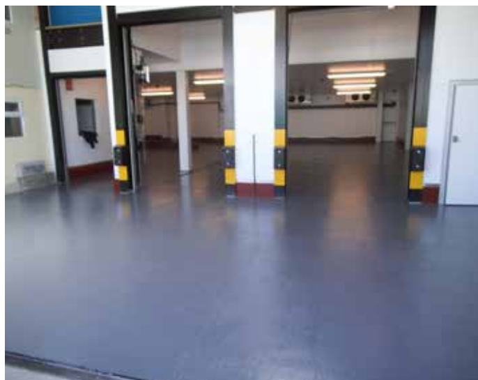
Piso de armazém de laticínio restaurado com Belzona 5231

Este material livre de solventes é fácil de misturar e aplicar com rolo, sem necessidade de trabalho a quente ou de ferramentas especiais.