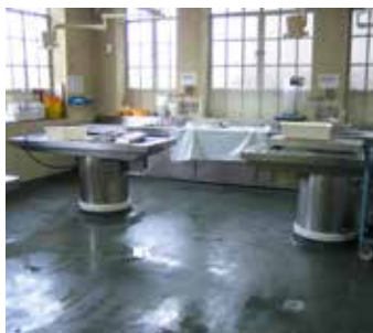
Piso de concreto antes