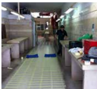
Piso ladrilhado antes