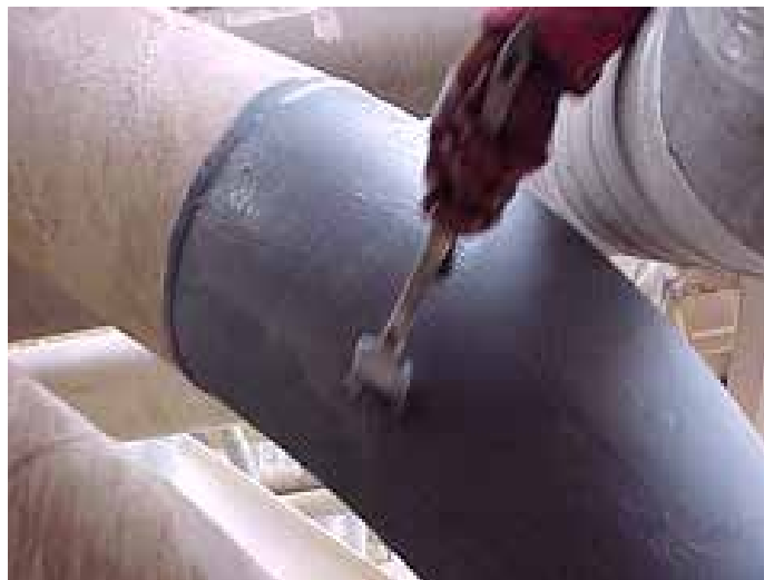
Belzona 5851 usado para proteção de duto contra corrosão

Não há necessidade de ferramentas especiais para aplicar Belzona 5841. Ele também é tolerante à preparação da superfície.