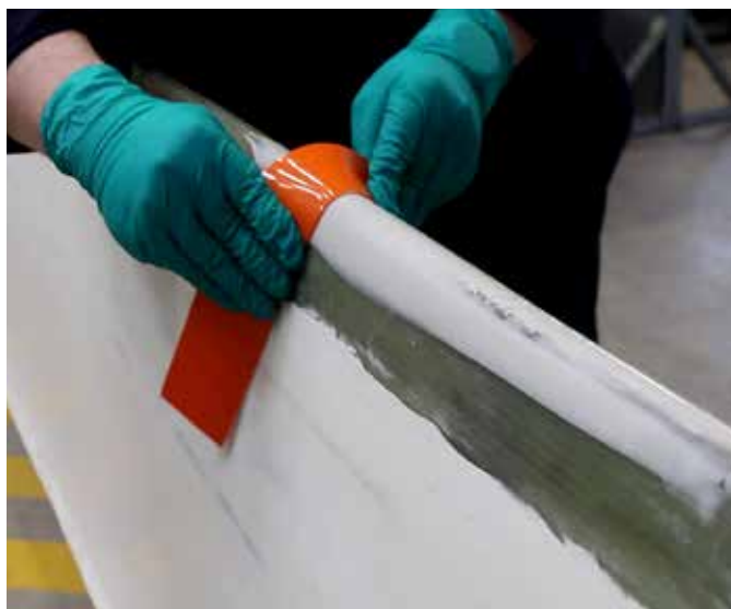
Fácil de moldar as bordas, sem necessidade de lixar.

Para obter mais informações, entre em contato com seu representante Belzona local: