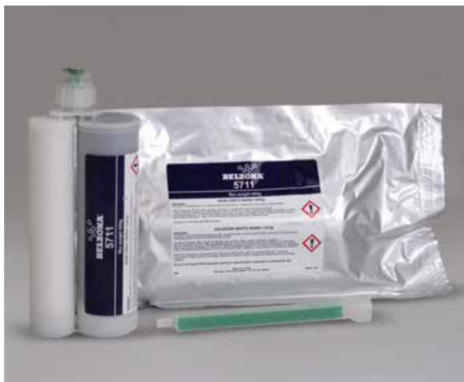
Belzona 5711 fornecido em cartucho com misturador estático.